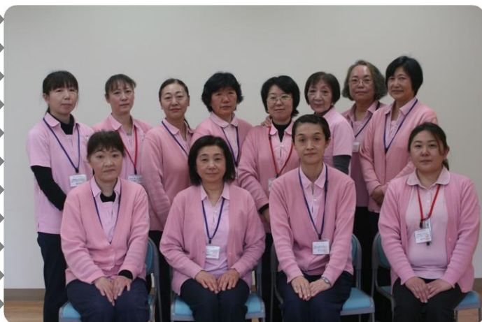
ホームヘルプスタッフ