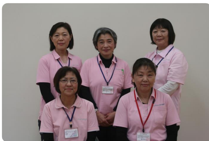
居宅介護支援スタッフ