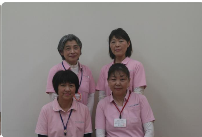
居宅介護支援スタッフ