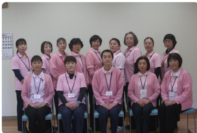
ホームヘルプスタッフ