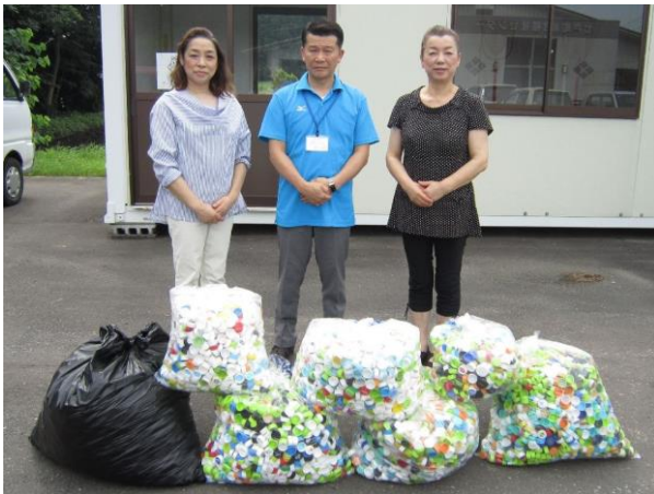
【7/26 七戸町商工会女性部】