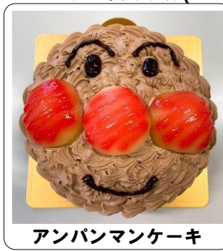
アンパンマンケーキ