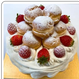
生デコレーションケーキ