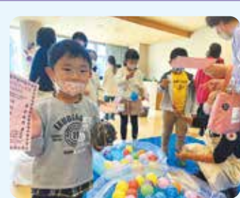
住民参加による福祉事業 「なないろフェスタ～社協感謝祭～」 七戸町赤十字奉仕団によるミニゲーム：ヨーヨー釣りを楽しむ参加者(令和4年度)