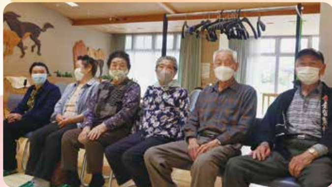
ゆうずらんど温泉入浴施設利用者の歓談の様子