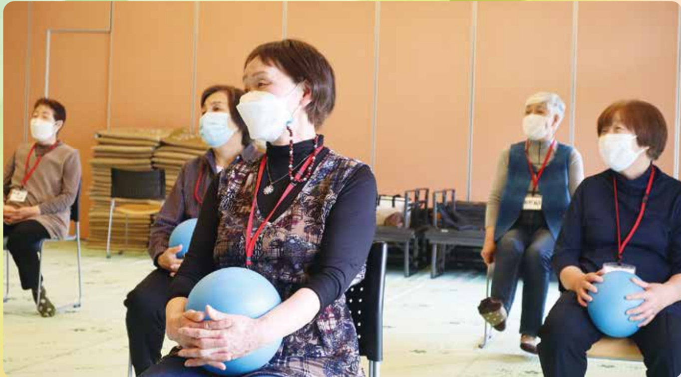
高齢者生きがい活動・認知症予防教室の様子