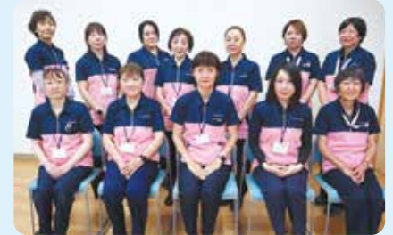
訪問介護事業所 ホームヘルパー

安心して暮らせる地域づくりを実現するために、地域での「見守り」「支えあい」の輪を広げ、「ともに支えあう住民参加のまちづくり」を推進しています。