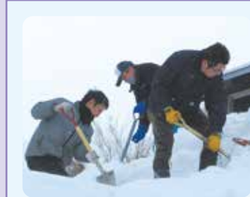
ボランティア活動 「天間林地区消防職員 ボランティア除雪活動の支援」 消防職員天間林の会による天間林地区での除雪ボランティア活動の様子(令和4年度)