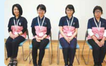
居宅介護支援事業所 ケアマネージャー