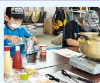
福祉教育事業 「子ども福祉体験スクール」 福祉体験「非常食を美味しく楽しく調理して食べてみよう！」の様子(令和4年度)