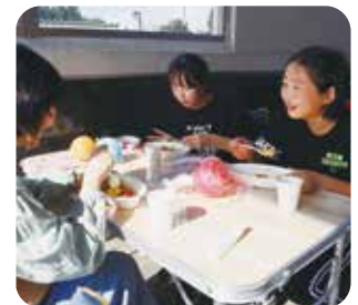
なないろフェスタ ～社協感謝祭～の様子