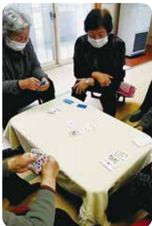
中野分館ほのぼの 交流会活動の様子