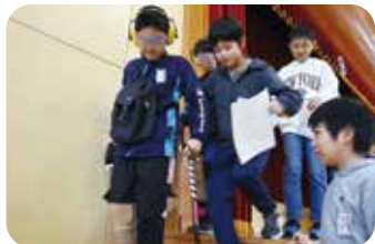
天間林小学校5年生

体験した天間林小学校の児童は、「はじめは、高齢者は身体が不自由で大変だと思いましたが、とても物知りだと分かったので、今度話を聞いてみたいです。」、七戸小学校の児童は、「体験を通して高齢者の気持ちが分かったので、今までよりおじいちゃん・おばあちゃんの役に立てるようにしたいです。」、七戸中学校の生徒は、「認知症の方と接する時には、怒ったり否定したりせず、受け入れることが大事なのだと分かりました。」などの感想を述べていました。