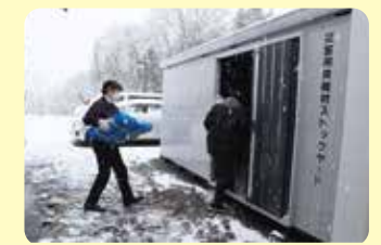
ストックヤードへの資機材搬入の様子

9月29日(金)、青森県社会福祉協議会より、被災地のボランティアセンターへの資機材の供給拠点として、本会に災害ボランティアセンター用資機材ストックヤードが設置されました。