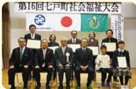
社会福祉に功績のあった方を表彰しました

本大会は、町の社会福祉の現状について学び、地域福祉の推進に功績のあった方々を顕彰し、住みよい町づくりを推進することを目的として毎年開催しているものです。今年も、去る11月10日(金)、七戸中央公民館において、来賓並びに町内会・分館・常会関係者、民生委員、一般参加者のご出席のもと、社会福祉に功績のあった方々に対して、七戸町社会福祉大会表彰7名・2団体並びに、令和5年度福祉標語コンクールの各部門最優秀賞3名の表彰を行いました。