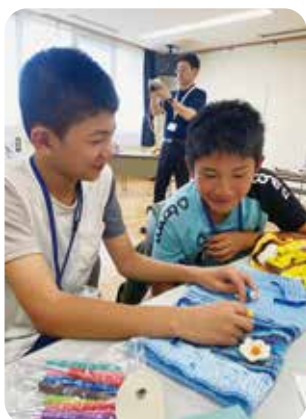
子ども福祉体験 スクール2023の様子

(有)日の出設備工業 東八甲田温泉 (有)丸喜運輸 丸美屋商店 向中野商会(有) 銘書堂