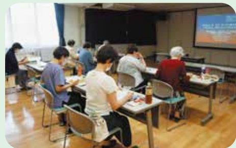
〔ボランティア・市民活動実践セミナーの様子〕

参加者より、「初めての参加で、難しく考えていましたが、実際に実践・体験しているお話に心打られました。」等の感想がありました。